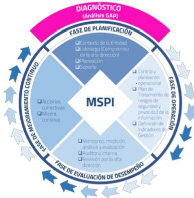
Ilustración 1 Ciclo del Modelo de Seguridad y Privacidad de la Información

La entidad ha adoptado el MSPI, acogiendo buenas prácticas y estándares internacionales. Cada una de las fases se dará por completada, cuando se cumplan todos los requisitos definidos en cada una de ellas.